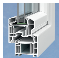
Variante : découpe semi-affleurante

d'atouts : les profilés multichambre utilisent les propriétés isolantes de l'air et satisfont ainsi aux exigences les plus rigoureuses en matière d'isolation thermique. Résultat : non seulement vous bénéficiez d'un agréable climat ambiant par tous les temps, mais vous réduisez aussi vos frais de chauffage pendant la période hivernale.