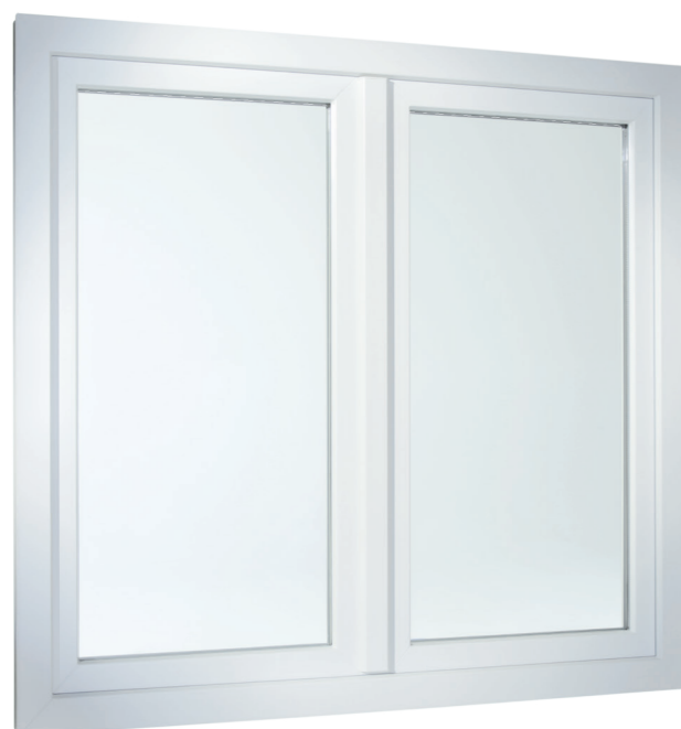
2-flügeliges Fenster in flächenversetzter Variante